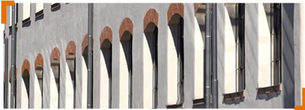
Innocel Innovations-Center Lörrach | westliche Fensterfront