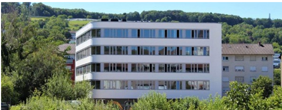
Neubau PharmaKorell im Innocel-Quartier | Georges-Köhler Straße 2